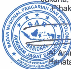
Al Amrad, S.Sos. Pembata Tk.I (III/d)